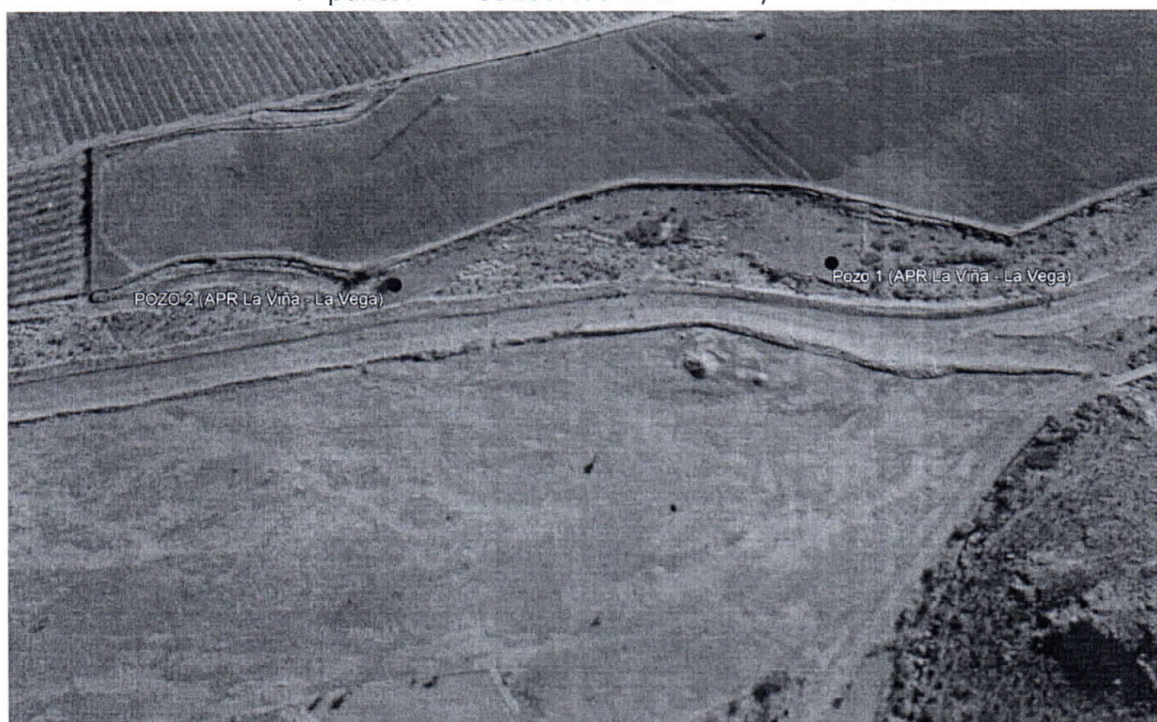
Imágenes Google Earth