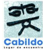
Imagen de Concientización