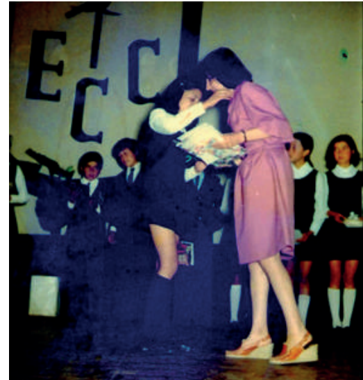
Licenciatura de Octavo básico- Escuela Consolidada. (1980).

Entre los años 1982- 1987, el teatro sirvió para realizar los festivales de canto, con competencias a la mejor canción e intérpretes netamente cabildanos y cabildanos cantantes que defendían ciertos repertorios musicales y se disputaban en este espacio que hemos descrito anteriormente.