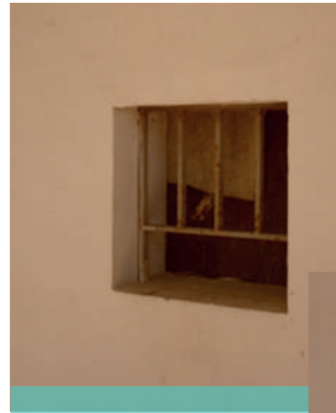
Antigua ventanillas de boletería y entradas del Teatro Municipal de Cabildo. Costado izquierdo.

EL TEATRO FUE ESENCIAL PARA REALIZAR EL "TELE PÓNGASE CON CABILDO" PROGRAMA QUE SE TRASMITIÓ AL AIRE CON EL FIN DE RECAUDAR MAS FONDOS PARA LA INSTALACIÓN COMPLETA DE LA ANTENA, SIENDO ESTA TOTALMENTE EXITOSA.