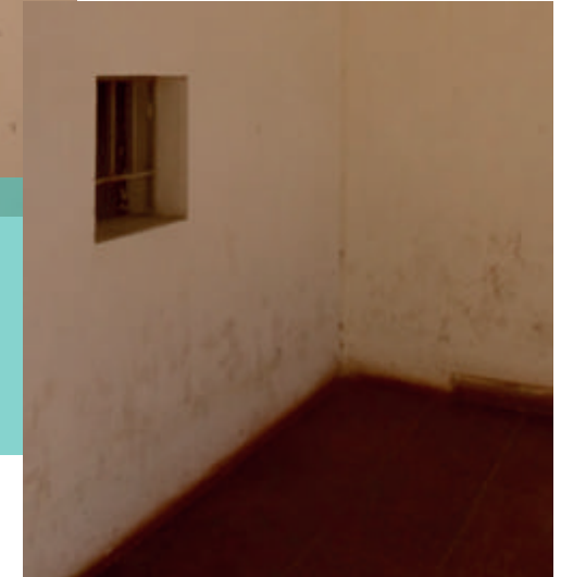
Antigua ventanillas de boletería y entradas del Teatro Municipal de Cabildo. Costado derecho.