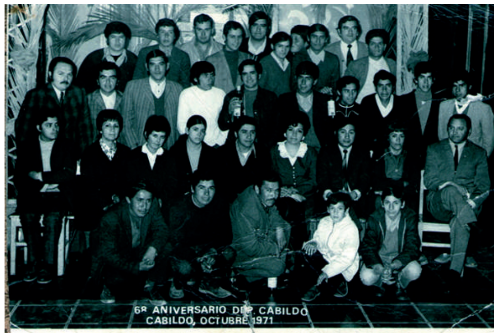
6º ANIVERSARIO DEPORTES CABILDO CABILDO, OCTUBRE 1971