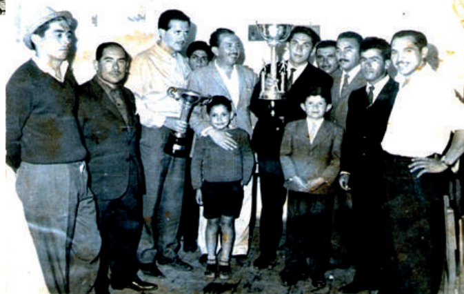
Copa Ganadora en una Semana Cabildana.