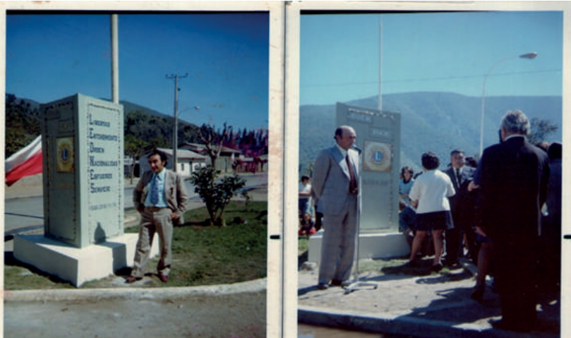
Inauguración Monolito de Bienvenida a Cabildo por Club de Leones, octubre de 1974.