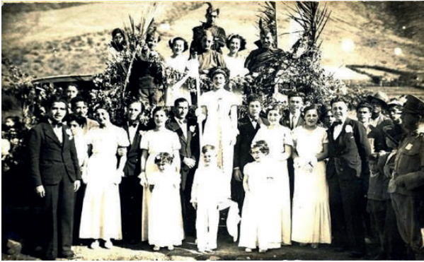
Fiestas Primaverales con Reina S. M. Sultana Primera, damas de honor, poetas laureados, pajes y autoridades de la época. Cabildo, octubre de 1936.

En este pasaje histórico y local se inicia la participación de la comunidad y sus clubes con las fiestas primaverales, las cuales consistían en la presentación de diversas candidatas a reina que competían por la corona, la banda de reina, el baile de coronación y sobre todo representar a la juventud de la época.