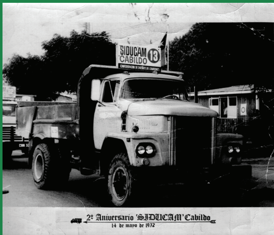
En la foto en el desfile que celebra su 2º Aniversario el 14 de Mayo de 1972.

Sindicato de dueños de camiones, se crea el 14 de Mayo, fue un Consultivo Provincial de Cabildo que reunía a todos los camioneros como gremio, en el Club Social para tratar temas relacionados del trabajo, reformas y una serie de actividades como el Aniversario, realizando un desfile de camiones con sus respectivos números pasando por toda la comuna. Muchos se detenían ver el paso de estos sacrificados habitantes de Cabildo.