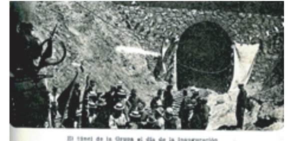
El túnel de la Grupa el día de la inauguración

● En Cabildo se iniciaron las faenas de construcción del ferrocarril al norte con importantes obras como los túneles El Álamo y La Grupa y un puente sobre el Río Petorca en Pedegua. Las faenas ocuparon la mano de obra de más 600 personas. La construcción del FF.CC de La Calera a Iquique fue una de las obras públicas nacionales más importantes de la época, ya que abarcaba más de 1200 Kilómetros. Se dice que se optó por el trazado por el interior ya que estar al alejado de la costa permanecía fuera del alcance de los cañones de los buques de guerra.