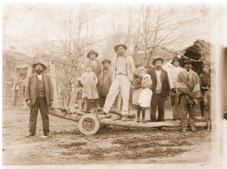
Primeros habitantes del pequeño poblado de Cabildo. (1873)

La iglesia abre su primer oratorio y todo señala que nos encontramos ante el surgimiento de un pequeño pueblito llamado Cabildo. Según decreto gubernamental con fecha 30 de Noviembre de 1885 se crean dos subdelegaciones para Cabildo la N°5 y la N°6 a San Lorenzo.