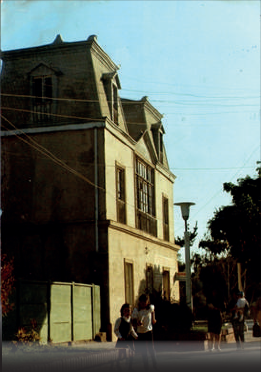
Segundo piso con ventanal hacia Avenida Humeres.