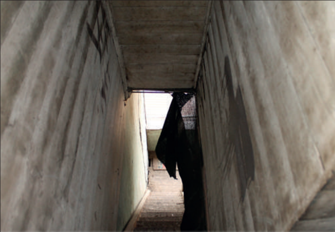
Pequeña escalera hacia el 3° piso