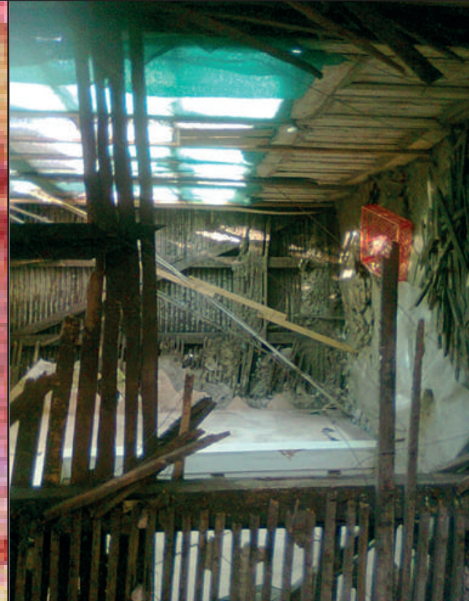
Segundo piso con ventanal hacia Avenida Humeres.