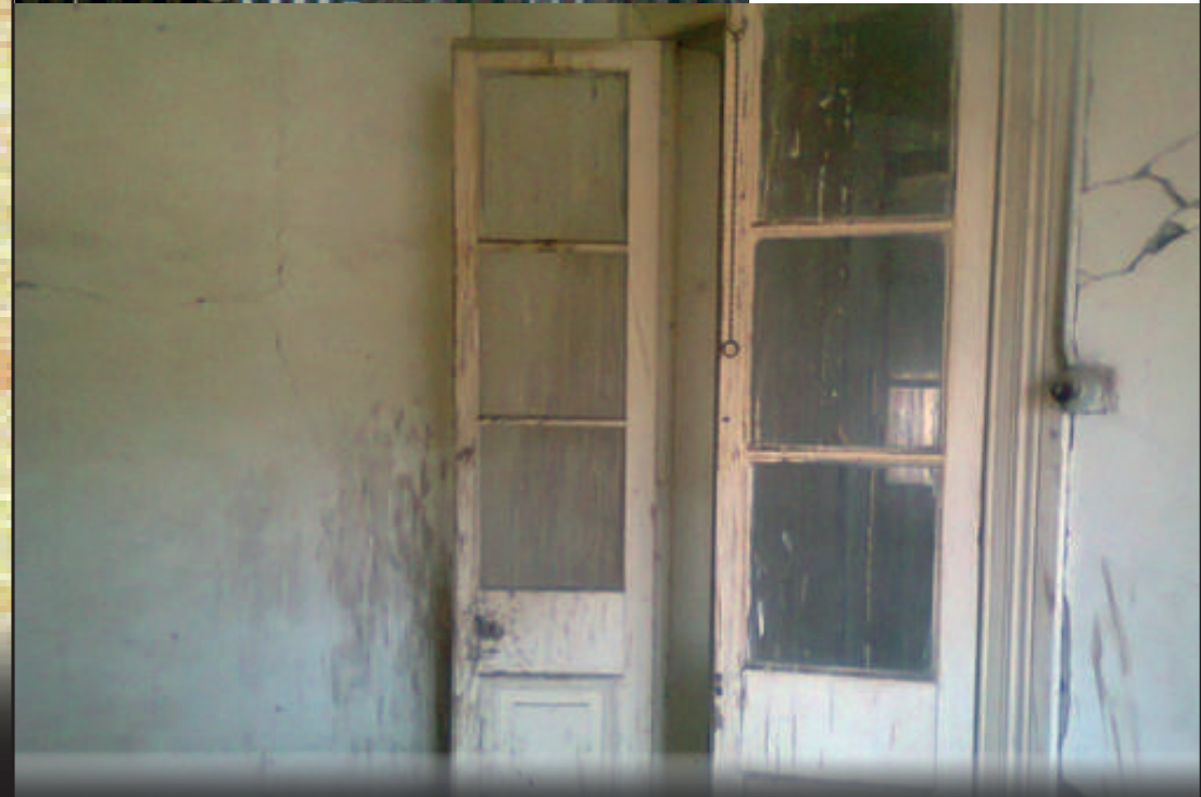
Acceso a las habitaciones del segundo piso.