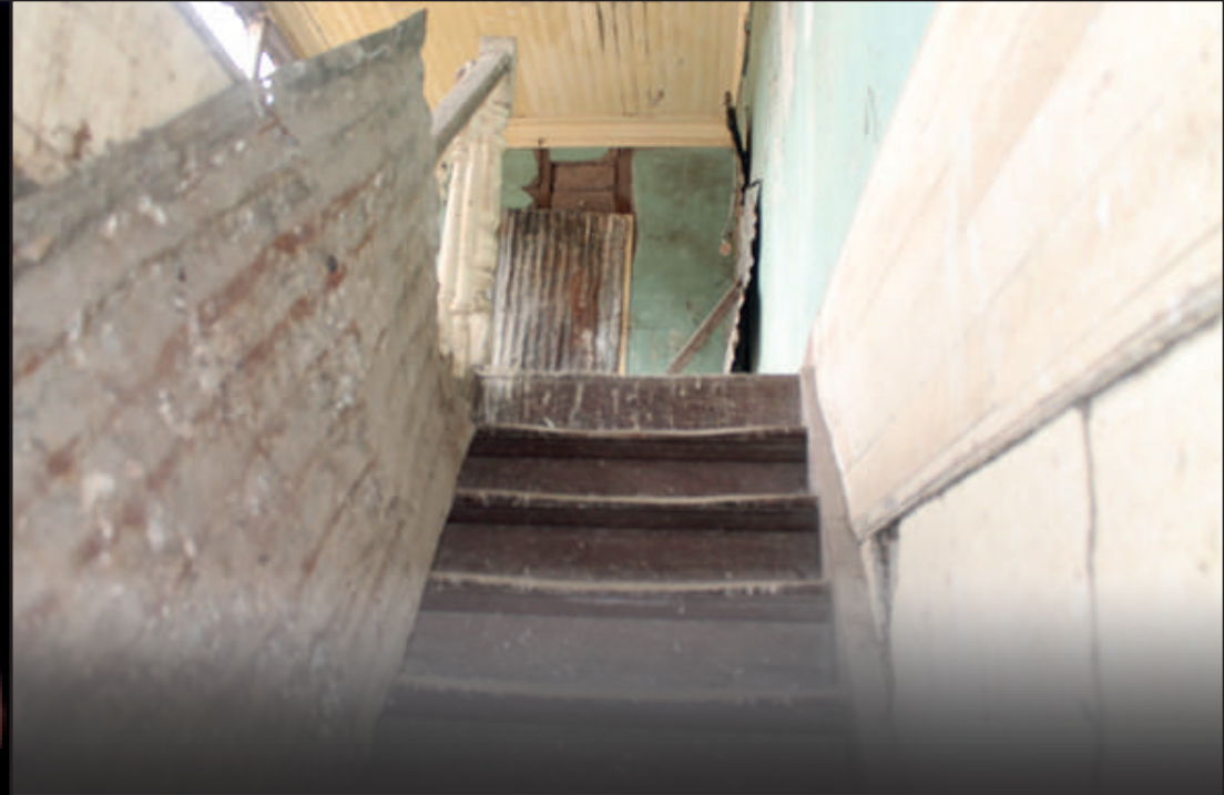
Acceso al segundo piso.