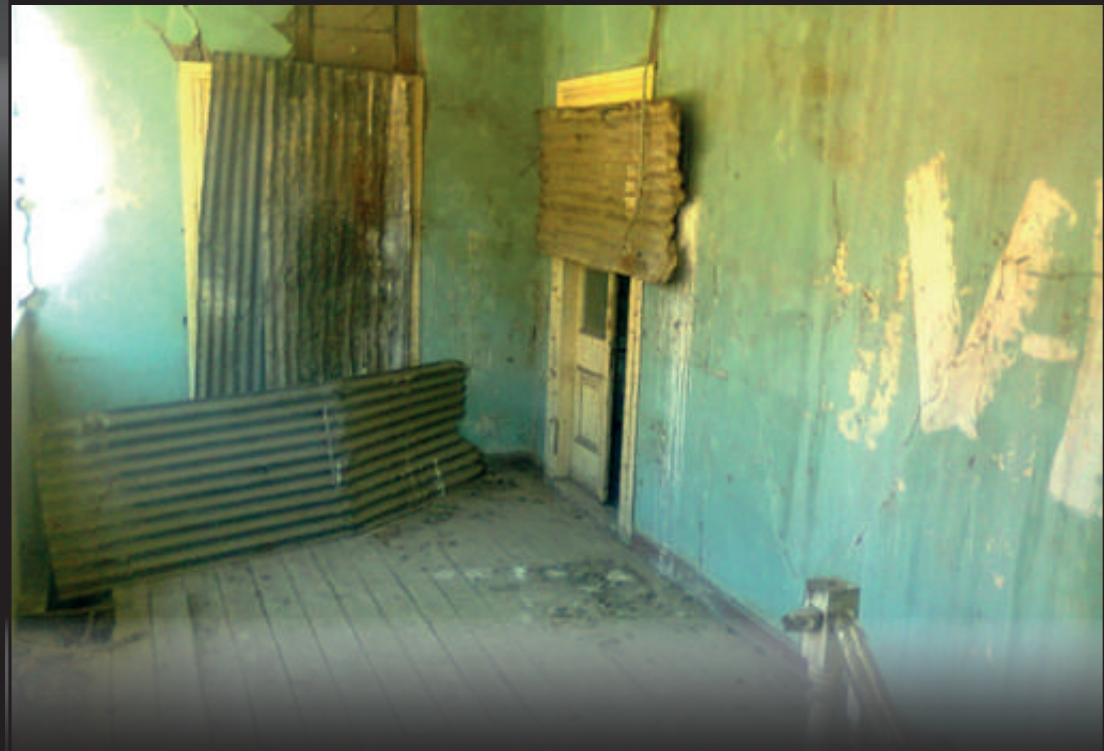
Segundo piso y terraza con vista hacia la Plaza de Armas.