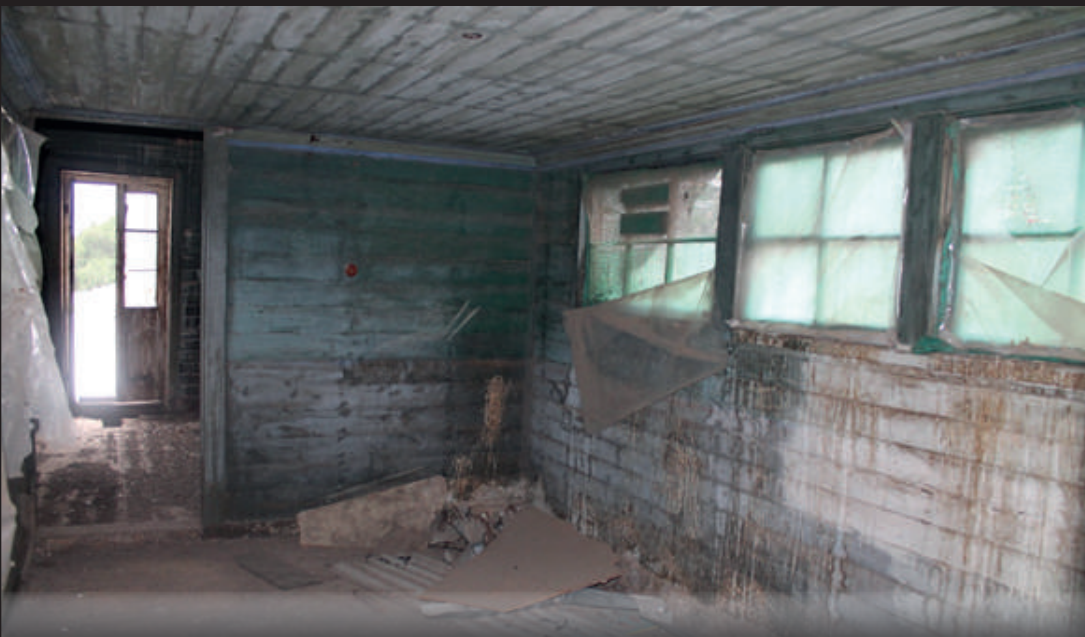
Pequeñas habitaciones del 3° piso.